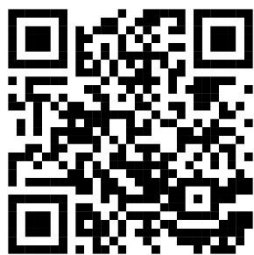
САЙТ МОАУ «СОШ № 5 г. Орск»