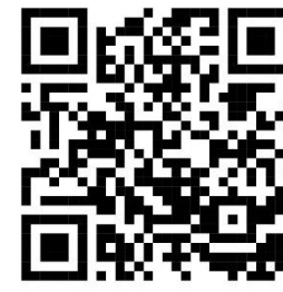
САЙТ МОАУ «СОШ № 5 г. Орск»